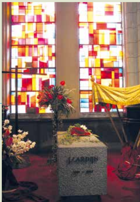
Le tombeau du cardinal est à l'église Notre-Dame de Laeken à Bruxelles.

Intercède pour nous auprès de Dieu par le Christ Notre Seigneur.