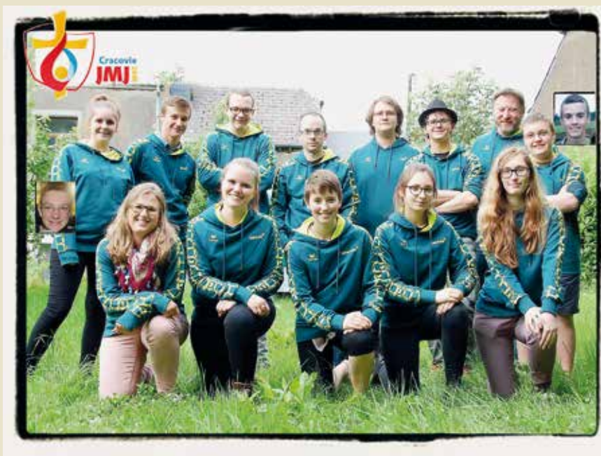
Le groupe des participants aux JMJ constitué à Habay.

▶ 16 octobre 15h journée jubilaire des familles à Arlon Venez vivre en Église et en famille la démarche jubilaire à l'église Saint-Martin. Passage de la porte sainte avec bénédiction individuelle des familles. Enseignement sur la miséricorde avec animation particulière par tranches d'âge pour les petits-enfants, les enfants, les ados et jeunes, les adultes. Démarche jubilaire en famille avec possibilité de vivre individuellement le sacrement de Réconciliation.